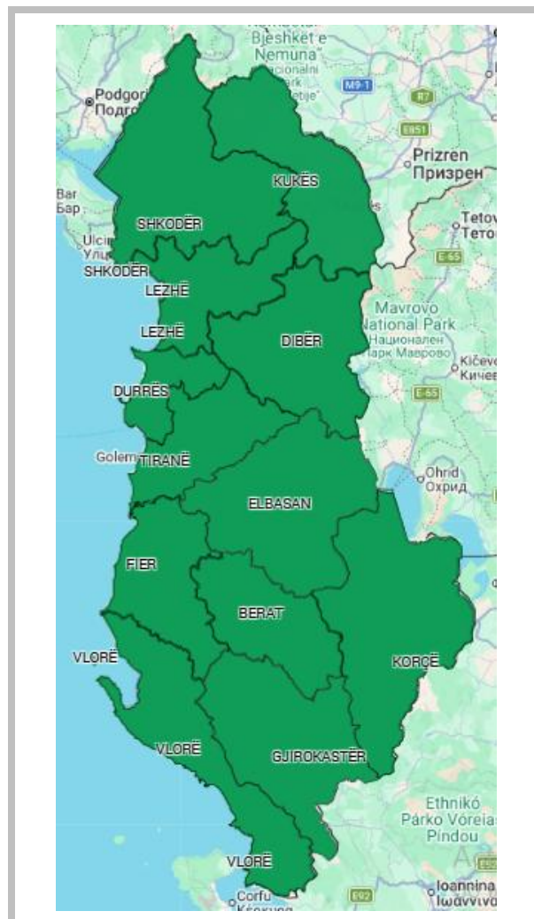
RREZIKU MAKSIMAL I QARKUT për sot dhe nesër, dt. 14–15.